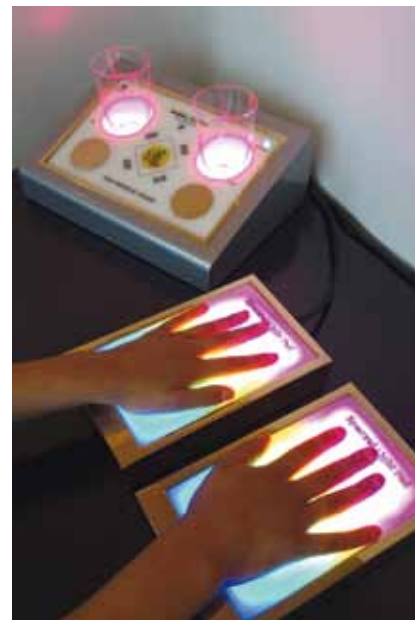
Abb. 3: Spectral Light Pads: zum Scannen und zur Regulation – einfach die Hände auflegen

setzt und die Regulation auf psychosomatischer Ebene in Gang setzt. Es ist eine ideale Ergänzung für Ärzte und Heilpraktiker sowie für Gesundheits-Coaches und medizinische Wellness-Zentren, die neue Horizonte erschließen und moderne Informations-Technologien in ihrer Praxis einsetzen möchten.